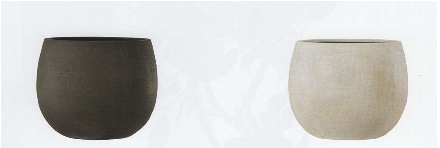
アンティークブラウン