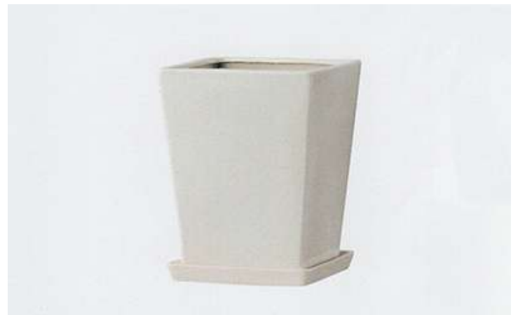
尺鉢用スクエア型 ¥17,000 L420×W420×H435

釉薬陶器：釉薬により素焼きした陶器の表面をガラス質が覆い、 小孔をふさぐために耐水性が増し、光沢が出る。