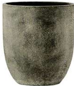
ブラックウォッシュ (BLW)