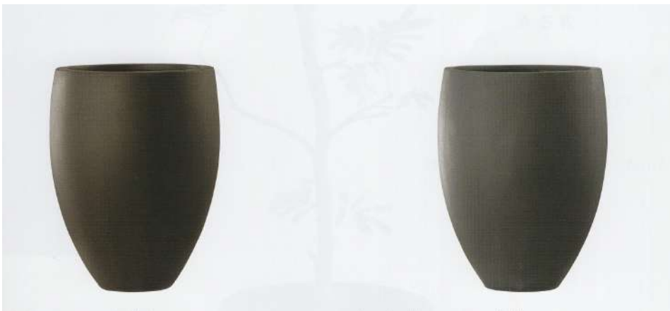
アンティークブラウン