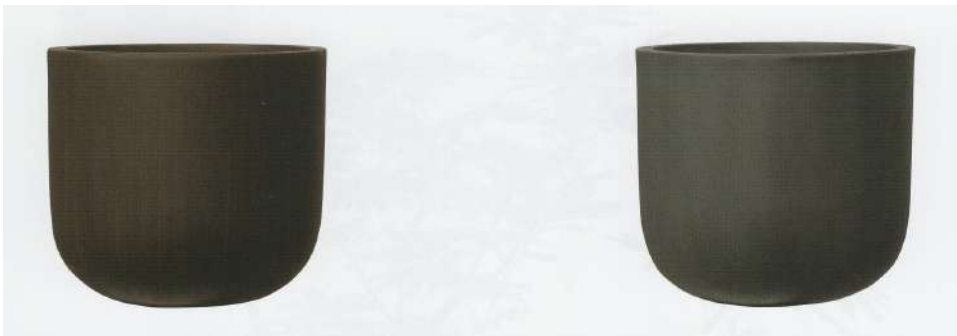
アンティークブラウン