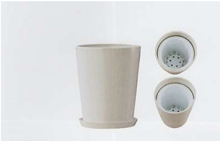
尺鉢用ラウンド型 ¥12,000 Φ360×H405